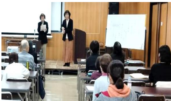
総会はスムーズに進みました